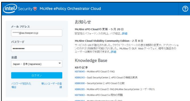
従来環境(ePolicy Orchestrator Cloud) https://manage.mcafee.com

従来環境である「ePolicy Orchestrator Cloud」から、新環境である「MVISION ePO」へと管理コンソールが変更となります。それに伴い、ログインURLが変更となりますが、移行開始から45日が経過したお客様につきましては、旧環境へアクセスした際に新環境へとリダイレクトされます。