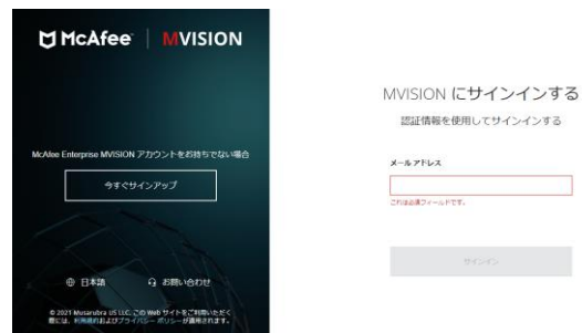
新環境(MVISION ePo) https://auth.ui.mcafee.com/